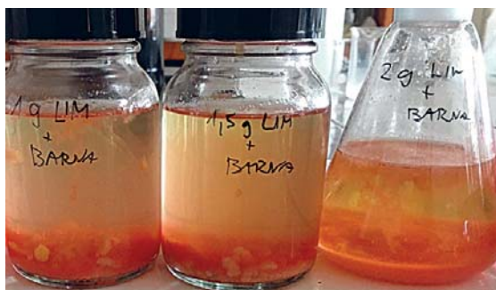
Slika 8: Odpadne vode s pigmentno barvo, čiščene z limoninimi olupki v koncentracijah 5, 7,5 in 10 g/l Figure 8: Pigment printing ink wastewaters treated with lemon peels in concentrations of 5, 7.5 in 10 g/l

Limonin olupek deluje kot drugi najučinkovitejši adsorbent, pri koncentracijah 5 in 10 g/l daje po dveh tednih 88,6 in 90-odstotni učinek čiščenja (slika 8). Voda je zaradi limoninih olupkov obarvana rjavkasto-rumeno ter pri višjih koncentracijah olupkov (12,5 in 15 g/l) tudi bolj motna, zato dobimo nižje vrednosti učinkov čiščenja.