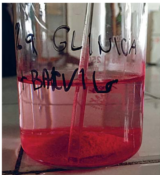
Slika 5: Odpadna voda, onesnažena z barvilom po čiščenju z glinico

Le nekoliko nižje rezultate razbarvanja kot hitozan daje glinica ( Al_2O_3 ), ki je najbolje očistila vodo pri koncentraciji 10 g/l s 95,8-odstotnim učinkom čiščenja do roza obarvanosti (slika 5).