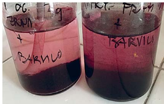
Slika 6: Odpadni vodi, onesnaženi z barvilom po čiščenju z 10 g/l aktivnega oglja v granulah (GAC) in z 2,5 g/l aktivnega oglja v prahu (PAC)

Komercialno najbolj uporabljeno aktivno oglje se je pokazalo kot nekoliko slabši adsorbent za barvilo kot hitozan, glinica in celo kot limonini olupki. Pri koncentraciji 7,5 g/l je aktivno oglje v zrnih po dveh tednih doseglo 90,1-odstotno razbarvanje odpadne vode z rdečim barvilom. Aktivno oglje v prahu se je zaradi močnega črnega obarvanja, ki ga povzroča, uporabilo pri nižji koncentraciji 2,5 g/l in doseglo enak učinek zmanjšanja obarvanosti (88,9 %) odpadne vode kot aktivno oglje v zrnih. Voda po čiščenju z aktivnim ogljem je roza do vijoličasto obarvana (slika 6).