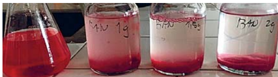
Slika 2: Izhodiščna odpadna voda, onesnažena z barvilom, in odpadne vode, čiščene s sušeno banano v koncentracijah 5, 7,5 in 10 g/l

Drugi najučinkovitejši biološko razgradljiv adsorbent je sušena banana, ki v optimalni koncentraciji 10 g/l daje po dveh tednih 94,6-odstotno zmanjšanje obarvanosti, voda je vizualno brezbarvna (slika 2). Pri čiščenju z višjimi koncentracijami banane (12,5 in 15 g/l) je bila odpadna voda bolj motna, kar je povzročalo višje vrednosti izmerjene absorbance in zato slabše učinke čiščenja.