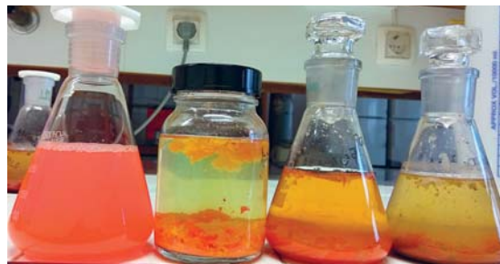
Slika 9: Od leve proti desni: izhodiščna odpadna voda suspenzije tiskarske barve, odpadne vode, čiščene z mandarininimi olupki, s pomarančnimi olupki in z avokadovimi olupki v koncentraciji 12,5 g/l Figure 9: From left to right; initial printing ink wastewater, wastewaters treated with mandarin peels, with orange peels and with avocado peels in concentration of 12.5 g/l

bili zmleti na nekoliko večjo velikost delcev, zato so vrednosti čiščenja nekoliko nižje. Voda po čiščenju z olupki agrumov res ni več motno rdeče obarvana, je pa še vedno rumeno obarvana, tudi zaradi barve olupkov, kar je razvidno na sliki 9.