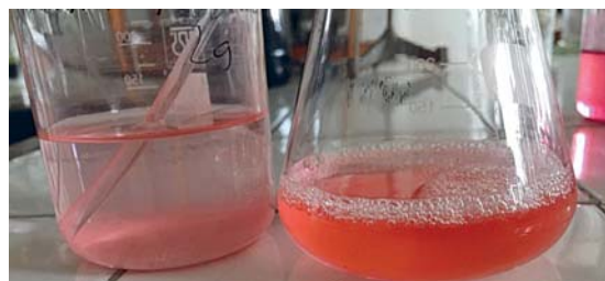
Slika 10: Odpadna voda, onesnažena s tiskarsko barvo po čiščenju z Al_2O_3 , in izhodiščna odpadna voda pred čiščenjem Figure 10: Printing ink wastewater after treatment with Al_2O_3 and initial wastewater before treatment

Olupek avokada se je pokazal kot najslabši med biološko razgradljivimi adsorbenti pri čiščenju odpadne vode, onesnažene s tiskarsko barvo, z le 43,7-odstotnim učinkom čiščenja, ki pušča rumenkasto-zeleno obarvanost (slika 9).