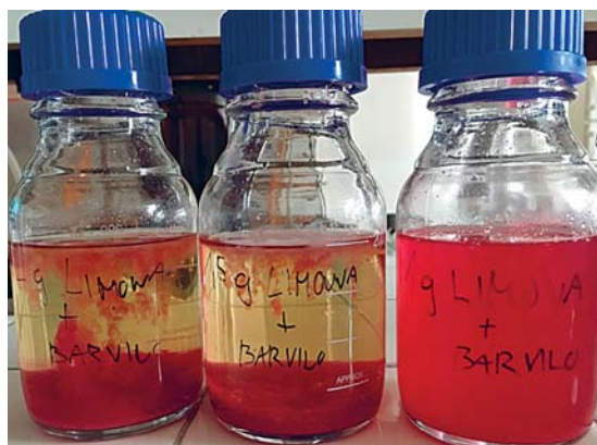
Slika 1: Odpadne vode, onesnažene z barvilom po čiščenju z 10, 7,5 in 5 g/l limoninih olupkov Figure 1: Wastewaters polluted with dye after treatment with 10, 7.5 and 5 g/l lemon peels

Limonini olupki so se v vodi, onesnaženi z direktnim barvilom, izkazali kot najučinkovitejši biološko razgradljiv adsorbent, ki v optimalni koncentraciji 10 g/l po dveh tednih doseže 96,6-odstotni učinek čiščenja. Na sliki 1 je razvidno, kako se s povečevanjem koncentracije limoninih olupkov zmanjšuje rdeča obarvanost odpadne vode; pri 5 g/l limoninih olupkov, kjer je doseženo le 24,8-odstotno čiščenje, je še vedno moč obarvana odpadna voda, pri 7,5 g/l (96-odstotno čiščenje) in pri 10 g/l limoninih olupkov (96,6-odstotno čiščenje) je voda očiščena do rumene obarvanosti, posedli limonini olupki pa so zaradi adsorpcije rdečega barvila rdeče obarvani. Pri večji koncentraciji limoninih olupkov (12,5 in 15 g/l) je bila čiščena odpadna voda preveč motna in zato so bili s spektrofotometrično določitvijo doseženi manjši učinki čiščenja.