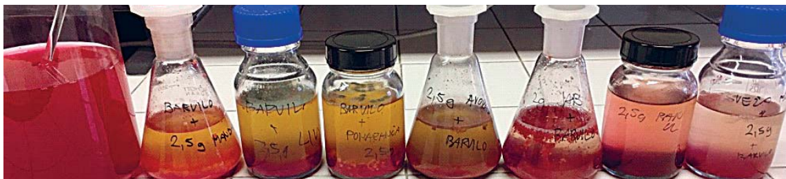
Slika 3: Od leve proti desni: izhodiščno onesnažena odpadna voda z barvilom, odpadne vode, očiščene z mandarinimi, limoninimi, pomarančnimi, avokadovimi, jabolčnimi in bananinimi olupki in z nesušeno (svežo) banano

Figure 4: Wastewaters polluted with dye after treatment with chitosan (left) and zeolite (right) in concentration of 12.5 g/l