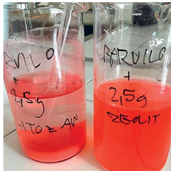
Slika 4: Odpadni vodi, onesnaženi z barvilom po čiščenju s hitozanom (levo) in z zeolitom (desno) v koncentraciji 12,5 g/l

Med vsemi proučevanimi adsorbenti se je najbolje izkazal hitozan, ki je naravni polisaharid, ta je pri koncentraciji 12,5 g/l dosegel 96,2-odstotno zmanjšanje obarvanosti odpadne vode, voda je vizualno očiščena do brezbarvnosti (na sliki 4 je voda zaradi