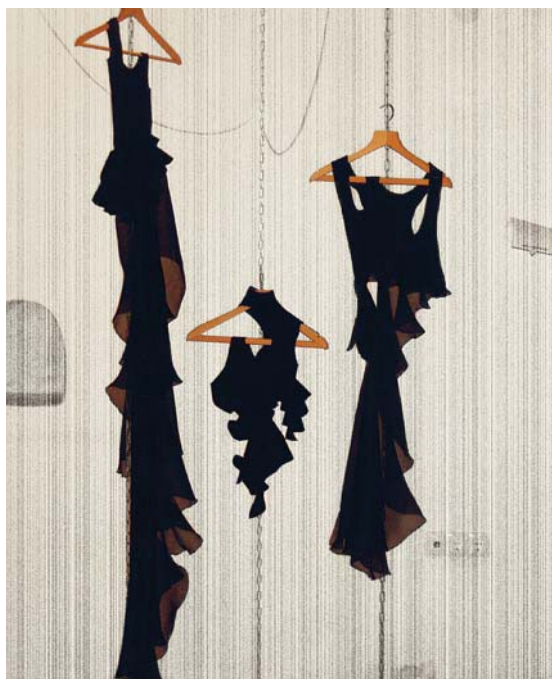
Oblika/Obleka, marec 2010, Squat

Razstava Summer Cou(l)ture je ena zgodnejših postavitev, ko se ob bok zrelemu oblikovalcu že postavi prva ekipa Young@Squata. Komercialno-umetniški projekt, ki ga v različnih interpretacijah v Squatu najdemo vsako leto, je zasnovan kot odgovor na poletne razprodaje, ki vsako leto v določenem času okupirajo prestolnico in naše nakupovalne navade.