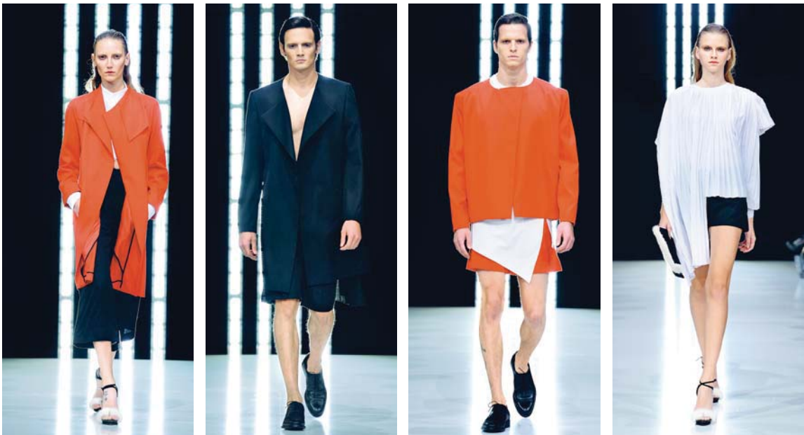
Kolekcija VARUHI KOLIBRIJEV, Fahion Week Ljubljana, oktober 2013

»Zgodbe o odraščanju, spominih na otroške sanje, vračanju k nekdanjim vrednotam, iskanju popolnosti, na novo zastavljenih sanjah in hrepenenju.« Zoran Garevski