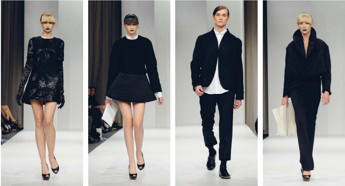
Fahion Week Ljubljana, april 2012

»Klasični Garevski«, bi lahko poimenovali črno in belo kolekcijo za zimo 2013, katere ozadje je po besedah avtorja Trenutek. Oblikovalec v svoji zreli fazi ustvarjanja, prepoznavna in tipična estetika minimalizma, nadgrajenega z eleganco, nežnostjo in feminilnostjo v ženskem delu kolekcije. Avtorske moške kolekcije v tem obdobju med poznavalci dosežejo skoraj ikoničen status.