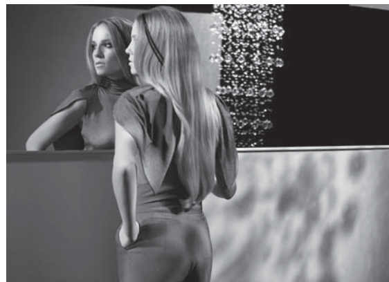
R-Exclusive, pomlad/poletje 2009