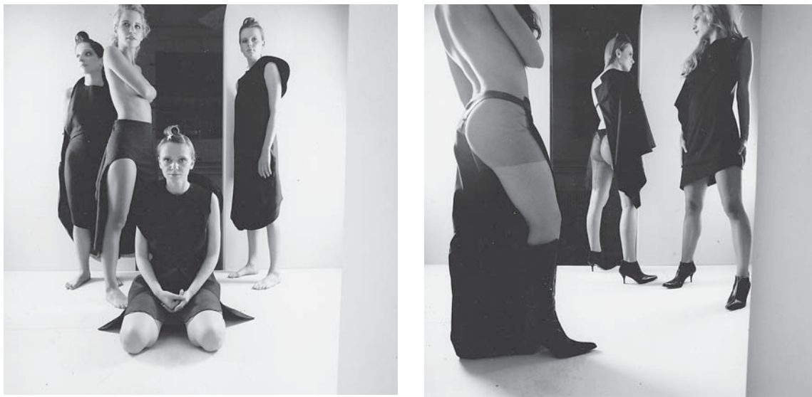
Zoranova prva kolekcija, predstavljena na zaključni reviji NTF, junija 2000

Zoranova prva kolekcija, predstavljena na zaključni reviji NTF, junija 2000. Radikalna estetika kolekcije v popolnoma črni barvi, poglobljena študija modelacije krojev, izhajajočih iz kroga, je za tisti čas pomenila popolnoma drugačen pogled na trenutne trende pri nas. Subtilen dialog med obleko in telesom, ki brez vsakršne vulgarnosti ponekod tudi razgalja in v svoji čistosti brezkompromisno pripoveduje o jasni viziji in samosvojesti mladega oblikovalca.