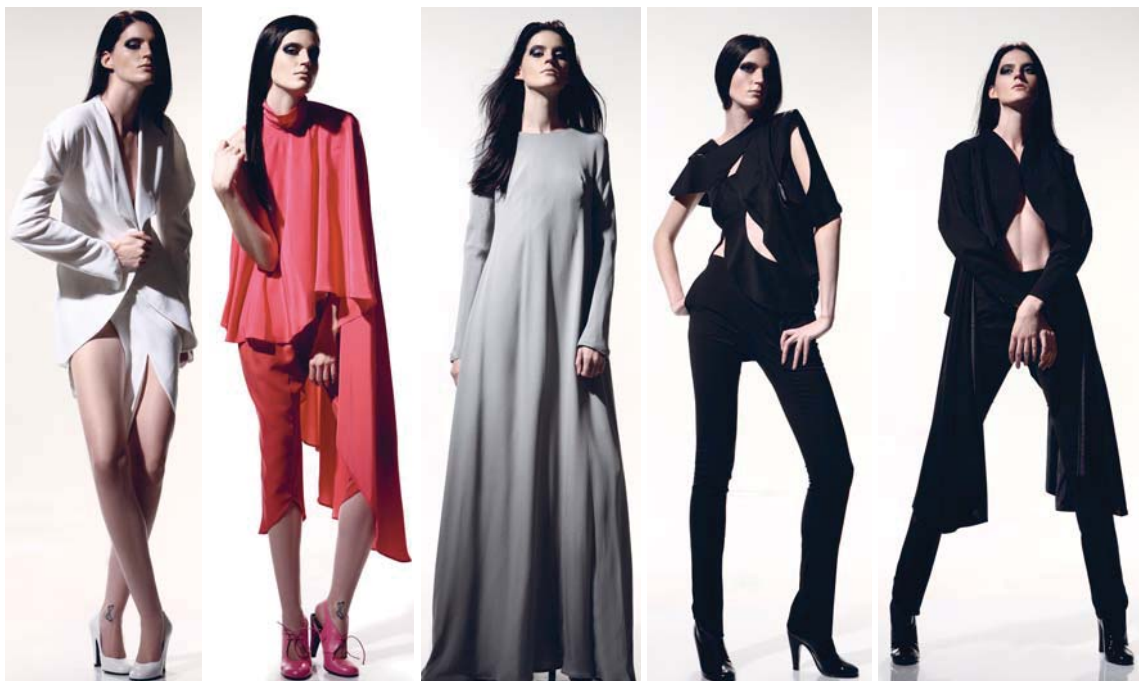
Art&Fashion, Zagreb 2008

Raziskovanje kroga v zrelejši in mehkejši različici. Sezonsko nedefinirana kolekcija, predstavljena v okviru razstave Art&Fashion v Zagrebu, 2008