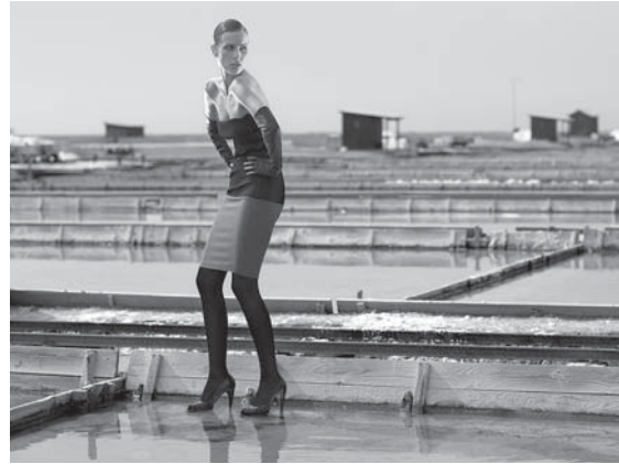
R-Exclusive, sezona jesen/zima 2007

Zadnja kolekcija R-Exclusive za Rašico, sezona pomlad/poletje 2009.