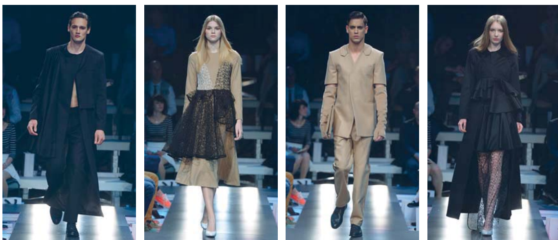
Kolekcija UJETOST, Fashion Week Ljubljana, april 2014

»Želje, vizije, sanje ... in realnost! Realnost, ki jih ujame v obliko, poskuša umiriti, racionalizirati in poslati na oder ... Tudi če za nekaj minut. Duša na dlani ... tudi če boli.« Zoran Garevski