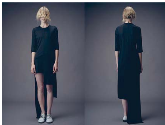
Summer Cou(l)ture, marec 2010, Squat